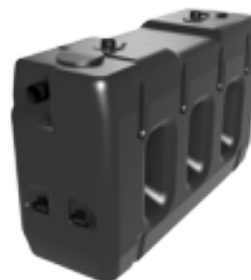
Rechthoekige septische en regenwaterputten Fosses septiques et citernes rectangulaire