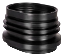
art OZ RW100

Les citernes rondes (5000l-7500l-10000l) peuvent être équipées d'un embout ovale télescopique allant jusqu'à 1 mètre et qui se raccorde parfaitement au trou d'homme de la citerne. Le couvercle de la citerne peut être utilisé pour s'ajuster au niveau de sol.