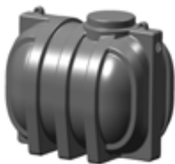
Ronde septische en regenwaterputten Fosses septiques et citernes rondes

De gebruikte grondstof is steeds eerstekeuzemateriaal PE, een materiaal dat als voornaamste eigenschappen een grote stevigheid maar toch slagvastheid heeft. Al onze tanks hebben dan ook een 100% lekvrije garantie en geven ten opzichte van de traditionele betonnen tanks een voordeel in gewicht, langdurig gebruik (PE wordt niet aangetast) en plaatsingscomfort.