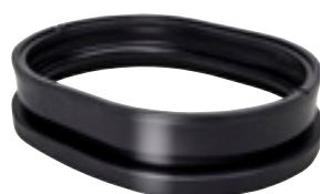
art OZ RW15

Opnieuw voor de ronde regenwaterputten (5000l-7500l-10000l) is een opzetstuk voor schacht 15 cm beschikbaar (bruikbaar indien de hoogte tot op het maaiveld beperkt is). De stukken kunnen onderling geconnecteerd worden om een hogere schacht in een veelvoud van 15 cm te bekomen.