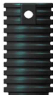
art OZ ST100