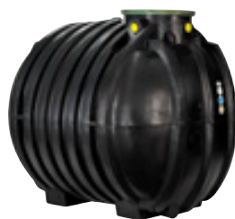
Ronde regenwaterputten Citernes rondes