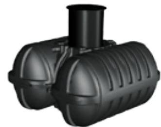
Platte regenwaterputten Citernes plates